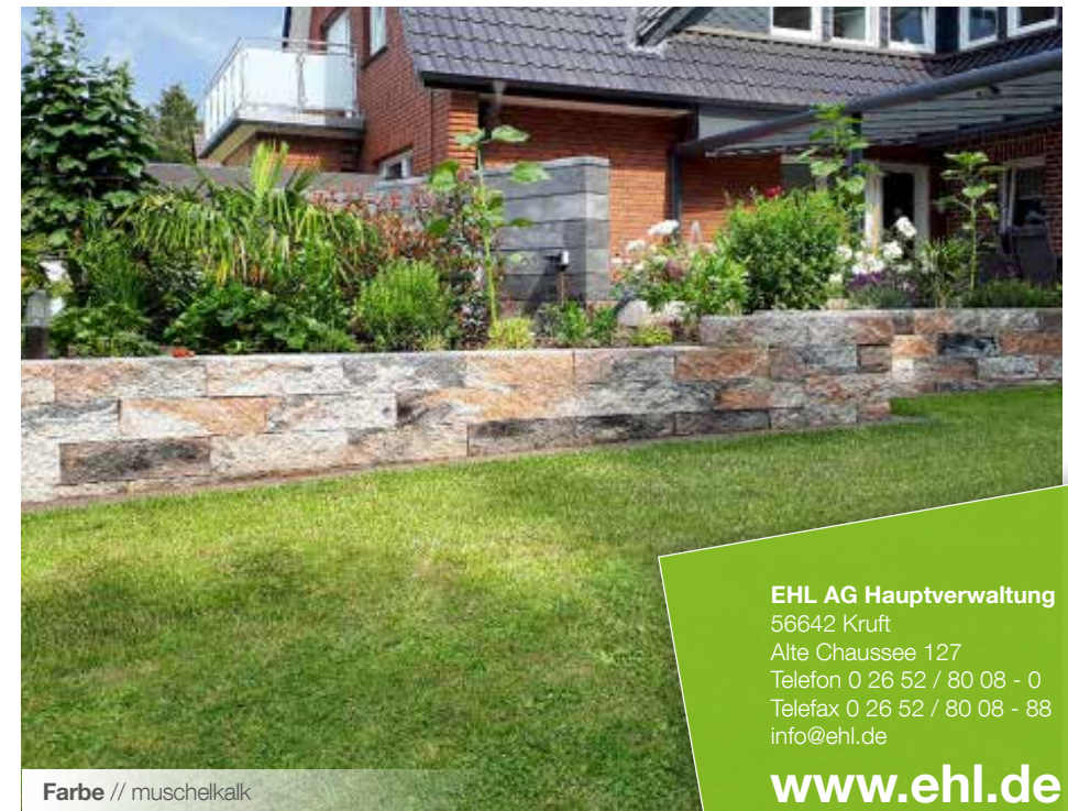
Farbe // muschelkalk

EHL AG Hauptverwaltung 56642 Kruft Alte Chaussee 127 Telefon 0 26 52 / 80 08 - 0 Telefax 0 26 52 / 80 08 - 88 info@ehl.de